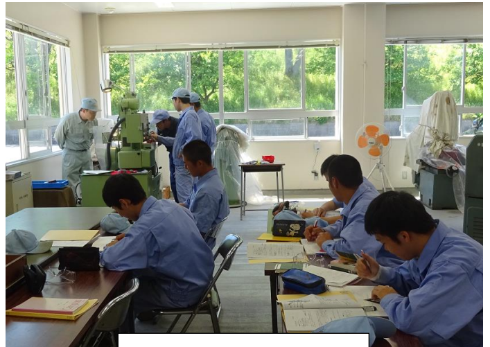
歯車を作っています(1)