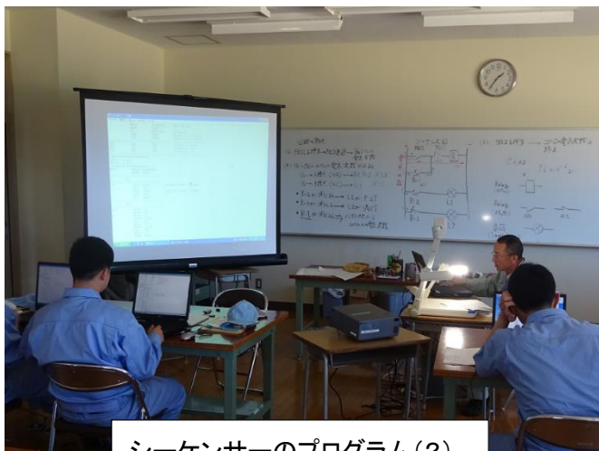
シーケンサーのプログラム(2)