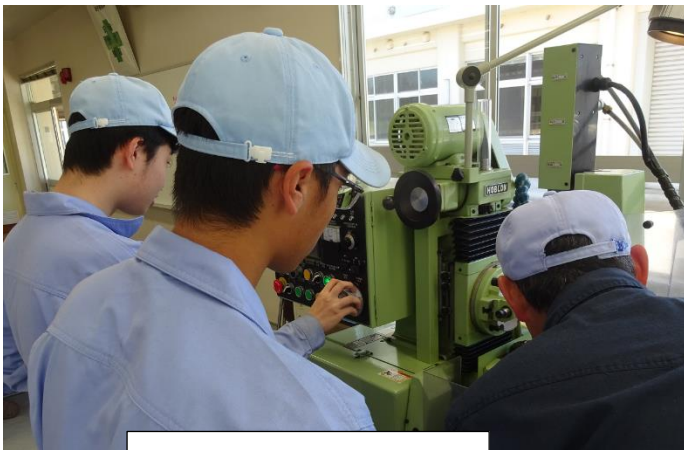
歯車を作っています(2)