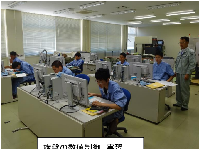
旋盤の数値制御 実習