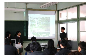
↑生徒が翔陽高校を紹介するスピーチをしています。