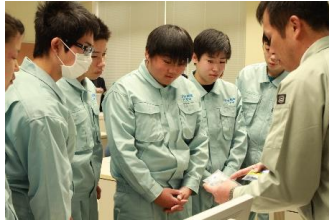
↑パワーポイントを使った説明、部品の実物を提示しています。