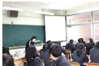
↑グループでの活動、実物投影機を使った説明をしています。